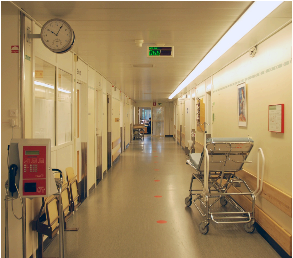
Malin Bellman, 100 heures aux urgences