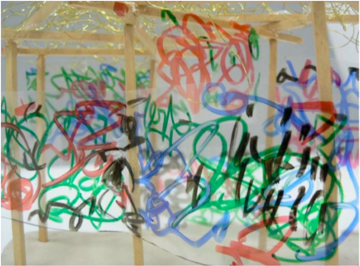
Yona Friedman, maquette pour le Musée des Graffiti