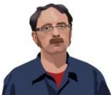
Alain Bublex, 2013.

Alain Bublex est un artiste qui recourt aux techniques et disciplines les plus variées. Tour à tour urbaniste, chercheur et voyageur, il crée des projets qui oscillent entre réalité et fiction pour réinventer l'idée du paysage, de la ville, ou de l'architecture. À travers son œuvre il met en place un dialogue entre les utopies modernistes et leurs possibles et imaginables adaptations à la société actuelle, notamment par un intérêt porté sur les multiples facettes des pratiques « artistiques » populaires. Né en 1961, Alain Bublex a récemment exposé à La Force de l'art 02, au Grand Palais à Paris, au CCC - Centre d'art contemporain à Tours, au Centre Georges Pompidou à Paris, au MAC/ VAL à Vitry-sur-Seine et au Musée d'Art Moderne et Contemporain de Genève en Suisse.